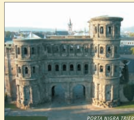
PORTA NIGRA TRIER

Diese Reise finden Sie auch im Internet unter: