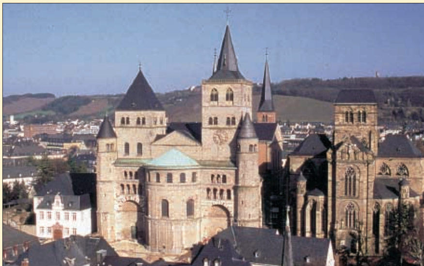
DOM LIEBFRAUEN TRIER

„Roma Secunda“ - zweites Rom wurde Trier von den Römern genannt und nirgendwo sonst in Deutschland wird die Römerzeit so lebendig wie in Trier. Beim Besuch von Amphitheater (Eintritt ca. € 1,-), Porta Nigra (besterhaltenster Torbau des römischen Weltreiches), Kaiserthermen und Dom werden Sie die Atmosphäre vergangener Jahrtausende schnuppern. Am Nachmittag können Sie die herrliche Innenstadt mit vielen Geschäften und kleinen Cafés auf eigene Faust entdecken. Alternativ empfehlen wir Ihrer Gruppe den Besuch der Bitburger Brauerei, in welcher Sie anschaulich den Weg von der historischen Braukunst zum modernen Großbetrieb verfolgen können (Führung € 5,- p.P.). Nach dem Abendessen bleibt Zeit für z.B. eine themenbezogene „Movie-Night“ im haus-eigenen Kinoraum im Yotel oder einen